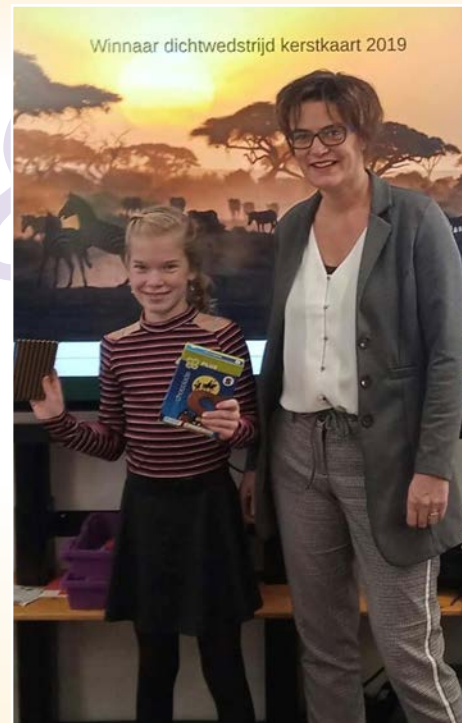
Winnaar dichtwedstrijd kerstkaart 2019